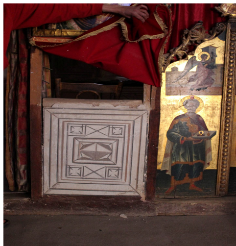
لوحة ١٢ تفاصيل: لزخارف هندسية على الجص