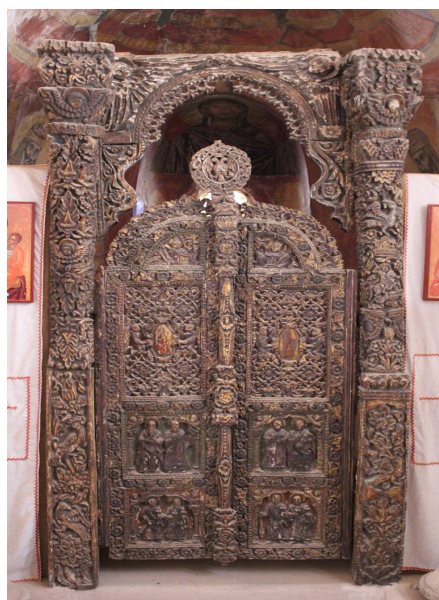
لوحة ١٣ حجاب كنيسة النبيين موسى وهارون