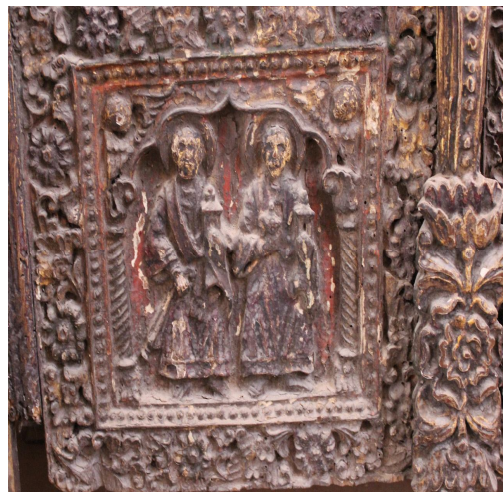
لوحة ١٥ تفاصيل: لأثنين من الشمامسة