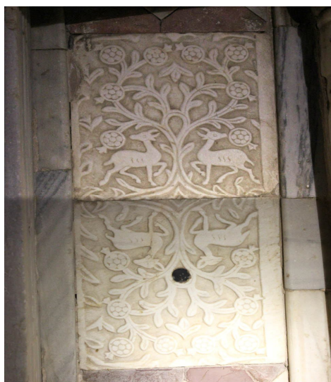
لوحة ١٨ أجزاء من بقايا الحجاب الرخامي القديم لكنيسة التجلى