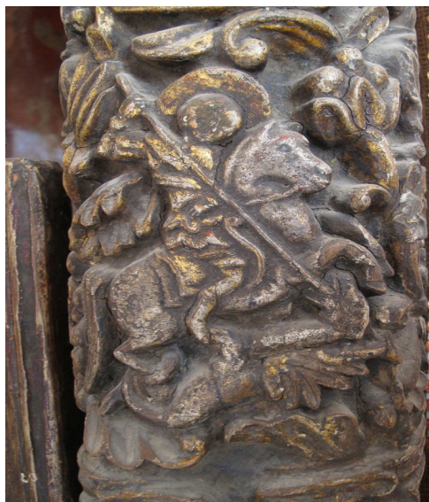
لوحة ١٦ تفاصيل: سان جورج يقتل التنين