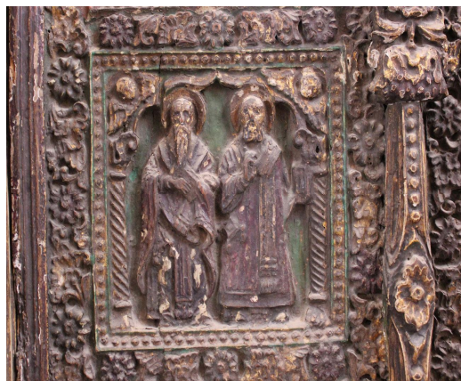
لوحة ١٤ تفاصيل: لآثنين من المطارنة