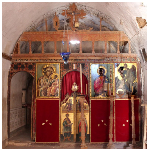
لوحة ١١ حجاب كنيسة يوحنا المعمدان